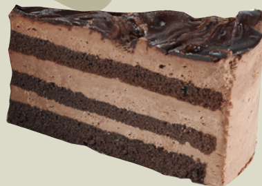
Chokolade Mousse lagkage