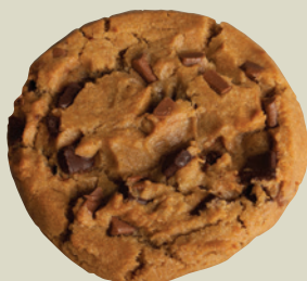
Triple chocolate cookie