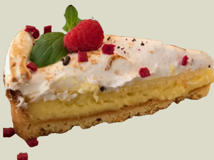
Citron marengs tærte