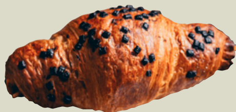
Italiensk cornetto (croissant)