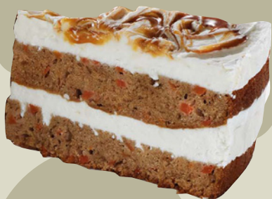
Karamel gulerods lagkage