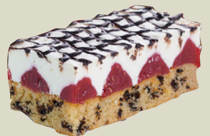
Hindbær stracciatella snitte