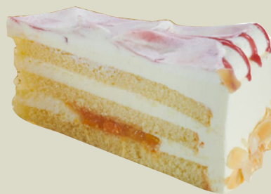
Peach melba lagkage