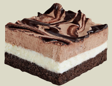
Chokolade Mousse snitte