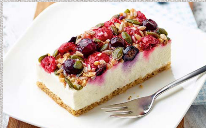
GLUTENFRI SKOVBÆR MÜSLI SNITTE 59,-