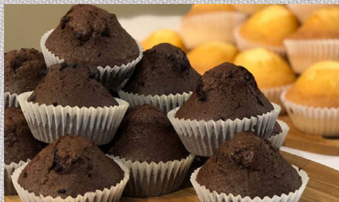
2 STK. GLUTENFRI CHOKO MUFFINS 59,-