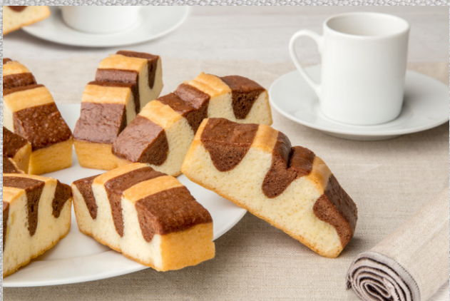
3 STK. GLUTENFRI MARMORKAGE 79,-