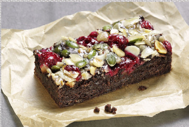
GLUTENFRI BROWNIE 49,-