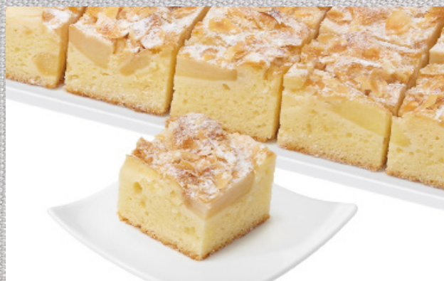
GLUTENFRI ÆBLEKAGE 49,-